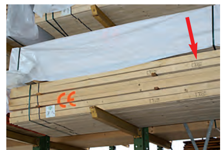
Abb. 4: Das CE-Zeichen ist eine gute Hilfe, maßgeblich ist jedoch die CE-Kennzeichnung (Pfeil)

Neben dem CE-Signet hat die CE-Kennzeichnung mindestens einmal auf dem Lattenbündel die Angaben in Abbildung 5 zu enthalten.