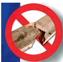
Abb. 2 und 3: Dachlatten müssen jetzt an einer Stirnseite rot markiert sein